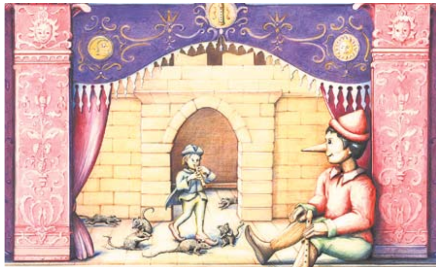
Pinocchio, der Flötenspieler, trifft im Märchen des Musikkollegiums Winterthur auf den Rattenfänger von Hameln.

Weihnachtsbasar: Sonntag, 18. Dezember von 12 bis 14 Uhr, Stadthaus Winterthur www.musikkollegium.ch