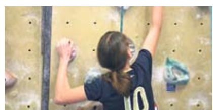
Noch steht die Wand im Block. pd.

Der Protest einiger Bewohner der Swica-Häuser am Eichenweg 66-76 (siehe «Winterthurer Stadtanzeiger» vom 4.10. und 25.10.) hat sich – zumindest teilweise – gelohnt. Ein Teil der Bewohner, die im letzten Frühling die Kündigung erhalten hatten und innert sechs Monaten – im vergangenen September – hätten ausziehen müssen, nahm sich einen Anwalt, um eine Fristverlängerung zu erlangen. Mit Ausnahme zweier Frauen, die eine Fristverlängerung bis Frühling 2013 erhielten, dürfen alle anderen von der Schlichtungsbehörde angehörten Bewohner bis Ende September 2012 in ihren Wohnungen bleiben. «Das verbessert die Chance, dass wir innert nützlicher Frist eine neue Bleibe finden werden», sagte stellvertretend einer der Bewohner. Der Umstand, dass die in vielerlei Bereichen bestens erhaltenen 51 Wohnungen teuren Neubauten und damit dem Profitstreben der Swica weichen müssen, stösst allerdings nach wie vor auf Unverständnis. gs.